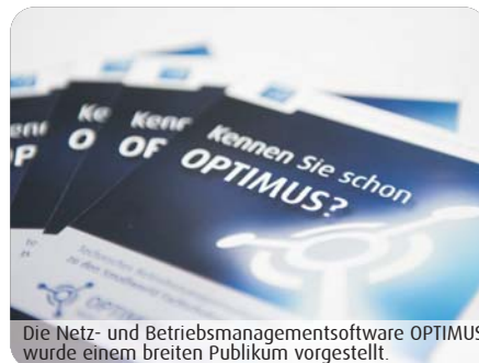
Die Netz- und Betriebsmanagementsoftware OPTIMUS wurde einem breiten Publikum vorgestellt.