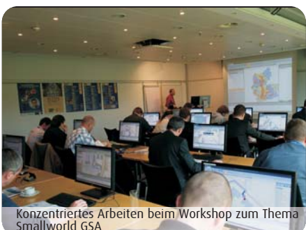
Konzentriertes Arbeiten beim Workshop zum Thema Smallworld GSA