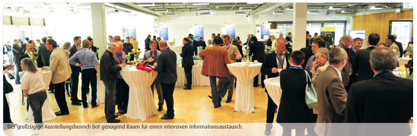
Der großzügige Ausstellungsbereich bot genügend Raum für einen intensiven Informationsaustausch.