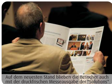
Auf dem neuesten Stand blieben die Besucher auch mit der druckfrischen Messeausgabe der "Solutions"