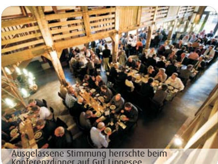
Ausgelassene Stimmung herrschte beim Konferenzdinner auf Gut Lippensee.