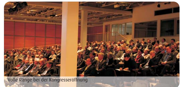
Volle Ränge bei der Kongresseröffnung