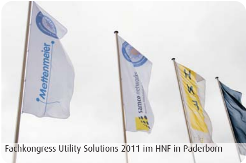
Fachkongress Utility Solutions 2011 im HNF in Paderborn